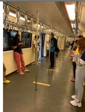
立つスペースでは、黄色の線で、それぞれが立つ位置が決められています。