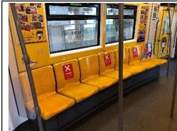
座席は1つずつ空けて座るようにしています