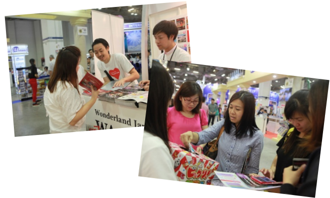
◆ブースイメージ（幅2mほどを想定）