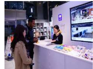
観光案内所約25か所