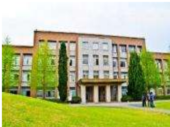
大学の留学生支援センターや 日本語学校など約20か所