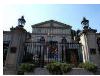
在京の各国大使館や商工 会議所など約45か所