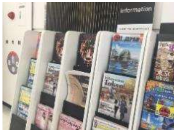
成田空港／羽田空港

東京在住の外国人 > 在京の各国大使館、商工会議所、アメリカンクラブ、外国人向けスーパー等