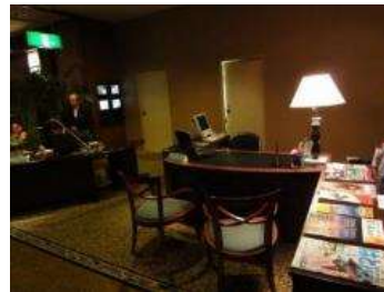
ホテル／コンシェルジュデスク 約170か所