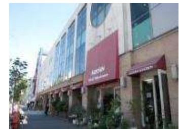
外国人向けスーパーやアメ リカンクラブなど約10か所